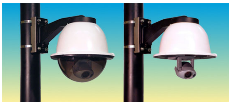
カメラを意識させないブロンズドームと下部ドーム未装着